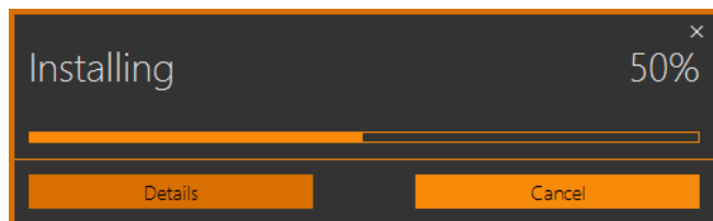
Рисунок 2 – загрузка и установка обновлений

На компьютер будут скачены и установлены последние обновления (рис. 2). После завершения следует нажать кнопку OK для запуска программы (рис. 3).